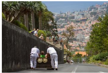
Carreiros do Monte @miquelmoniz

Su historia nos remonta al siglo XVIII, cuando Charles Murray, el cónsul inglés, compró la propiedad, ubicada al sur de la iglesia de Monte, y la convirtió en una granja. En 1897, fue adquirido por Alfredo Guilherme Rodrigues, quien construyó aquí una residencia palaciega, luego transformada en un hotel llamado "Monte Palace Hotel". El Monte Palace Madeira - Tropical Garden está compuesto hoy por alrededor de 100.000 especies de plantas de todo el mundo.