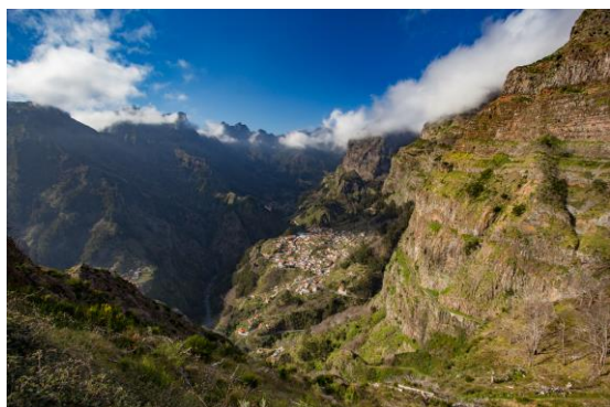
Eira do Serrado