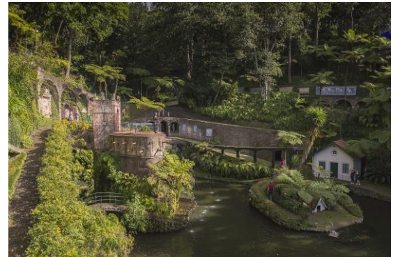
Jardins Monte Palace

Visita guiada al Jardín Tropical Monte Palace : Monte Palace Madeira - Jardim Tropical es uno de los espacios más singulares de la isla de Madeira, marcado por su flora exótica y el arte que lo rodea.