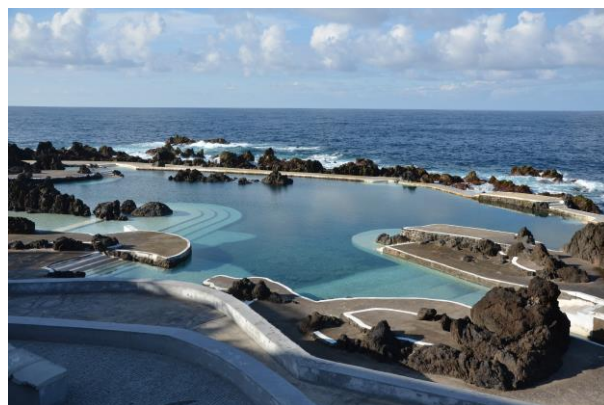
Piscinas Naturais do Porto Moniz

Al finalizar el almuerzo, visitaremos las Piscinas Naturales en Porto Moniz ; Las Piscinas Naturales de Porto Moniz son uno de los principales atractivos de la costa norte de la isla de Madeira. Este punto de interés conquista a un número creciente de visitantes por la peculiaridad de su belleza y el confort que ofrecen sus infraestructuras. De origen volcánico —formado durante milenios por el enfriamiento de la lava—, la fisonomía natural de estas pozas permite la entrada constante del mar. El agua tiene, por tanto, un nivel de calidad considerado de excelencia, dada su incesante renovación.