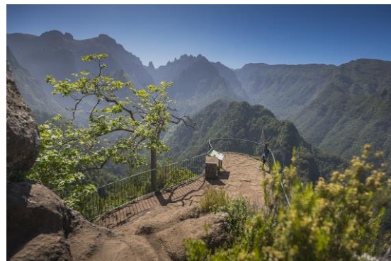
Levada dos Balcões

Seguiremos por la Levada dos Balcões , donde realizaremos una caminata de unos 60 minutos, nivel muy fácil. Es un pequeño sendero, de 1,5 km (+ 1,5 km de ida y vuelta), que te lleva a disfrutar de las vistas desde el Miradouro dos Balcões . Partiendo de la Estrada Regional n.º 103, en Ribeiro Frio, este sendero de dificultad fácil, con una duración prevista de 1h30, acompaña a la Levada de la Serra do Faial