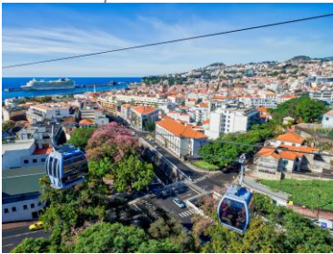
Funicular para Monte

A continuación, cogeremos el Funicular para Monte . Actualmente, el Teleférico de Funchal representa un punto de interés turístico ineludible en la isla. Este medio de transporte conecta el centro de Funchal y la parroquia de Monte, ofreciendo la experiencia memorable de sobrevolar la ciudad y las montañas.