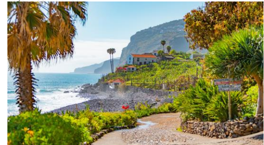
Fajã dos Padres

Visita a Câmara de Lobos : El nombre de este municipio proviene del hecho de que, en el momento del descubrimiento de la isla, había una gran cantidad de lobos marinos en la cala que aún hoy se pueden encontrar aquí con la misma configuración