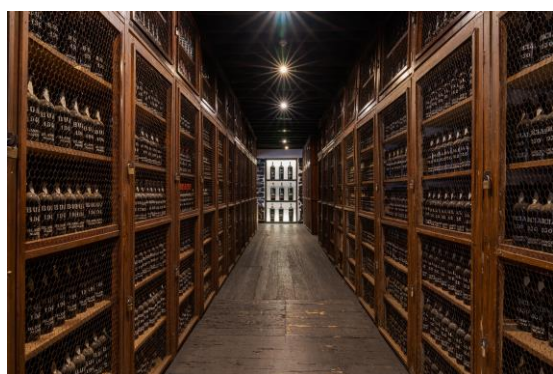
Bodegas Vino Madeira

Visitaremos las bodegas de Vino Madeira The Old Blandy Wine Lodge con prueba de dos vinos. Es en Funchal donde tienen su sede muchas de las empresas que llevan el legado del Vino de Madeira, e incluso en la capital, en el espacio adyacente a donde se encontraba el Convento de São Francisco, en el siglo XVII, que la Madeira Wine Company – Blandy's Wine Lodge , estableció su sede. En un negocio que permanece en la misma familia y que data de 1811, aquí se encuentran las bodegas de Vino Madeira más antiguas del archipiélago.