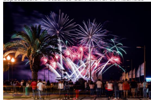
Espectáculo Pirotécnico del Festival do Atlântico

Al finalizar el almuerzo, seguiremos visitando el Mirador de Guindaste en Faial y el Mirador de Punta de São Lourenço : El extremo más oriental de la isla es una visita obligada para cualquiera que desee explorar los encantos de la costa este de Madeira. Punta de São Lourenço ofrece un entorno único e imponente, con vistas panorámicas sobre los lados norte y sur de la isla.