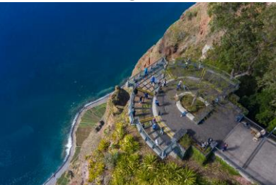
Cabo Girão

Al finalizar el almuerzo, visita al Cabo Girão (segundo cabo más alto de Europa a 580m): Con 580 metros de altura, Cabo Girão es el promontorio más alto de Europa, pero esa no es la única razón por la que se ha vuelto cada vez más famoso en todo el mundo. Su mirador, con la famosa plataforma suspendida de vidrio —llamada skywalk— es actualmente una de las atracciones turísticas más visitadas (y sin duda la más fotografiada) del municipio de Câmara de Lobos y del archipiélago de Madeira.