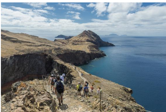
Mirador Punta São Lourenço